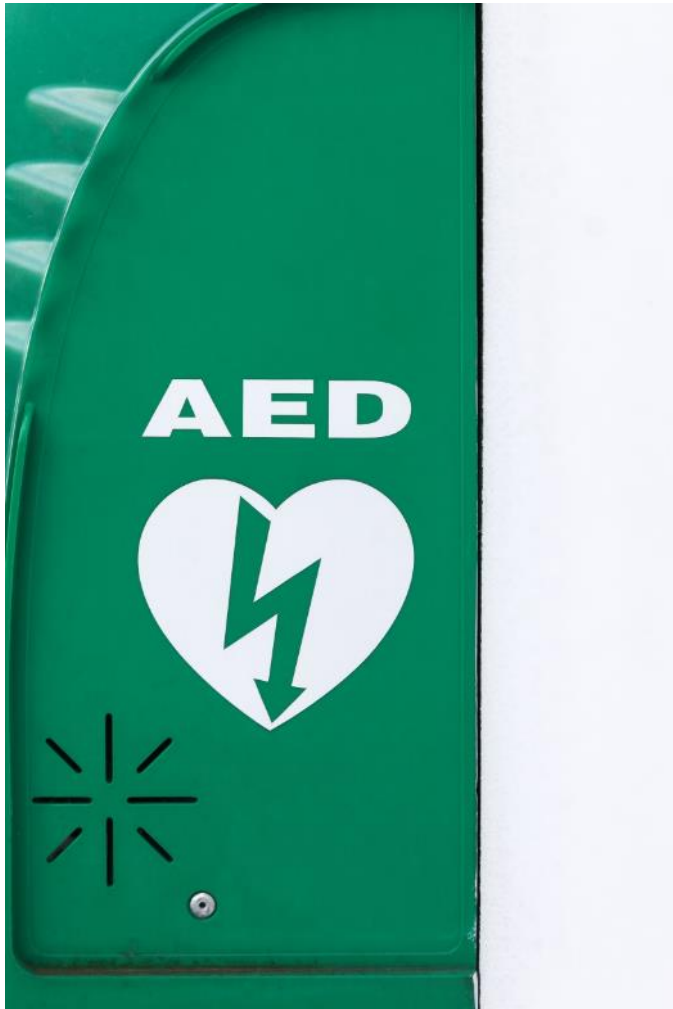
Figur 1. Der findes mange AED'er rundt om i Danmark. Se her, hvor de findes:

https://hjerterstarter.dk/find-hjerterstartere/find-hjerterstartere